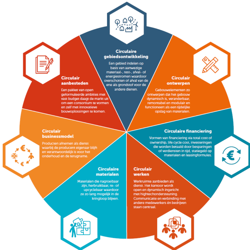
Figuur 1- de 7 pijlers van circulair bouwen